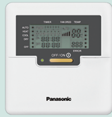
Wired Remote Control CZ-RD514C